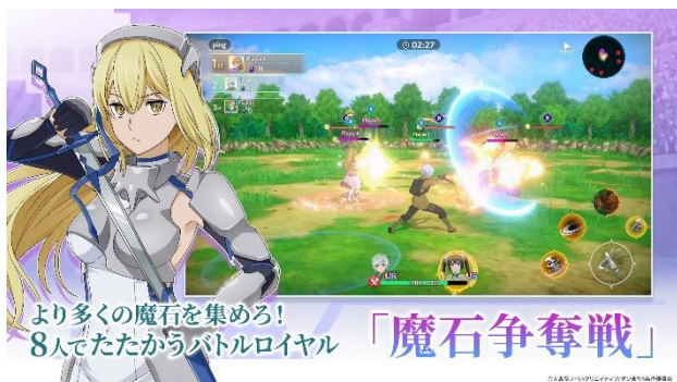
多人数でたたかうバトルロイヤル