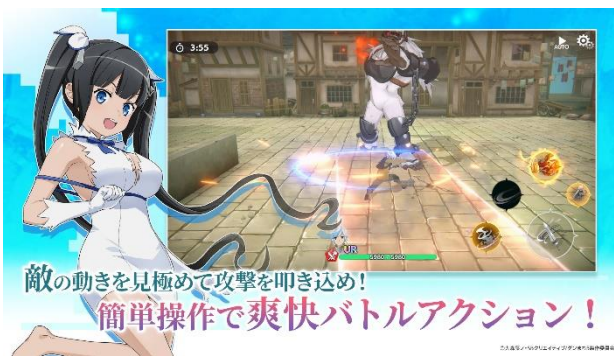
爽快感抜群のバトル