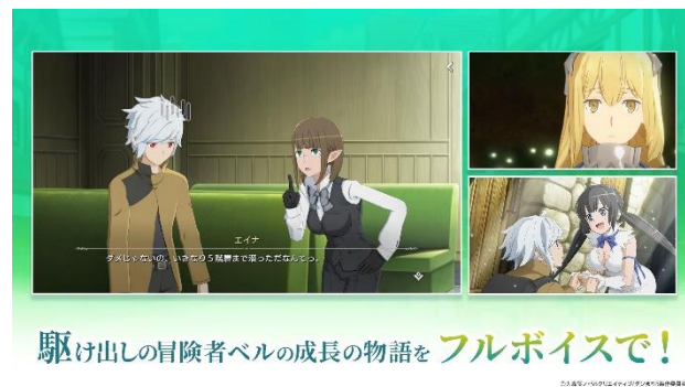
アニメのストーリーを追体験

ゲーム紹介 PV 第 1 弾 : https://youtu.be/BbZu_u_gaeQ