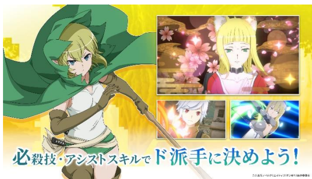
大迫力の 3D で描く必殺技